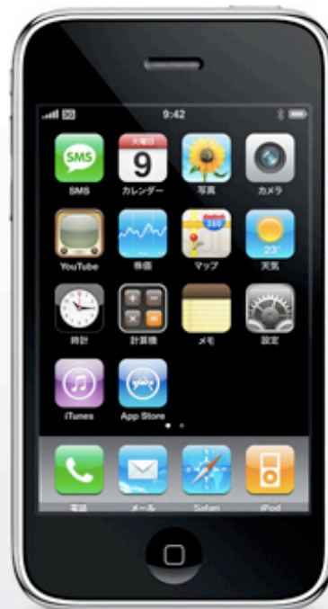
電話、iPod、インターネット