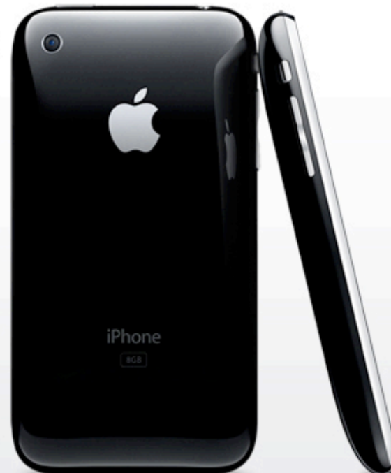
高速ネットワーク